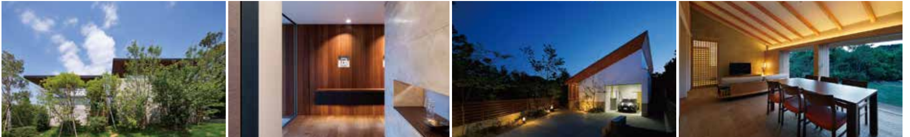
使用写真(左から) 設計:河川佳介/設計:岸研一/設計:河川佳介